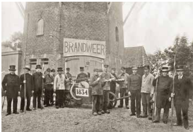
Welgelegen als brandweerkazerne, foto dateert uit 1933.

In Van Tjepkema tot Welgelegen zijn meer dan 150 veelal niet eerder gepubliceerde foto's en documenten opgenomen. Hierdoor is dit een uniek boek, voor zowel Heerenveners als molenliefhebbers. En zeker voor de donateurs van molen Welgelegen!